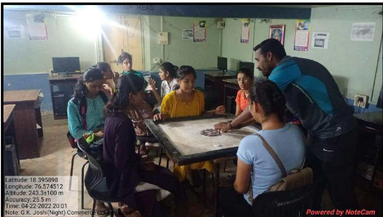
Students enjoying Carrom Competition