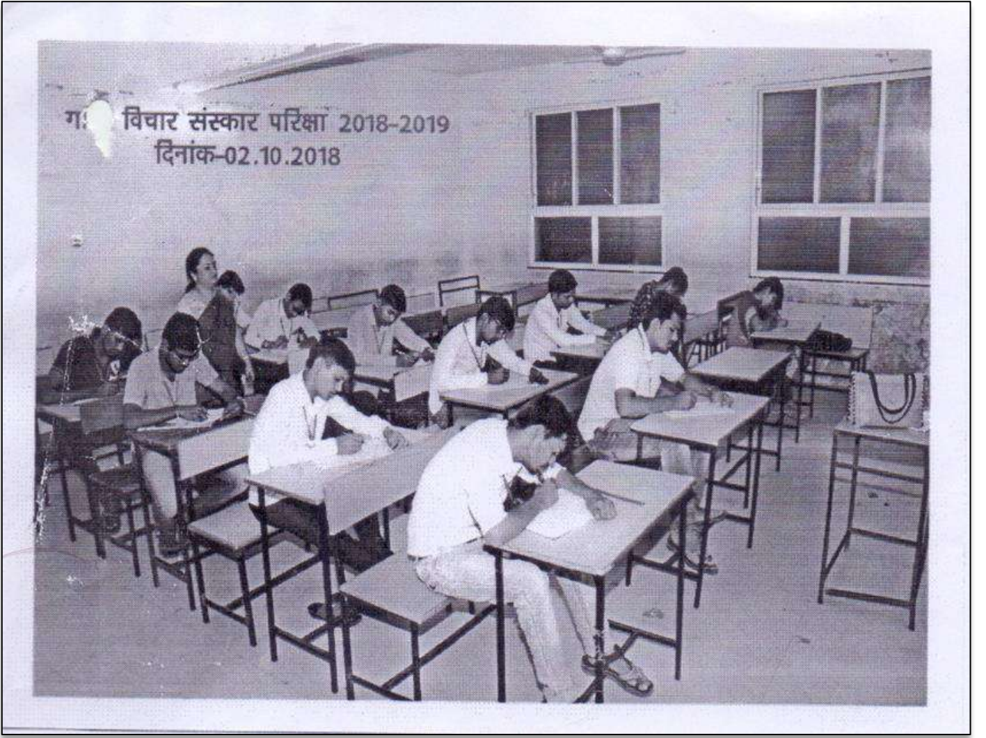
Samples of Students Opinion about Gandhi Vichar Sanskar Exam 2018-19